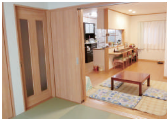
▲今の家のLDKは、引き戸を開ければ広～い空間に。冷暖房時は閉めれば省エネです。

Q 断熱性と気密性を高めることで、冬の室温3℃の家から快適な温度の家に生まれ変わ