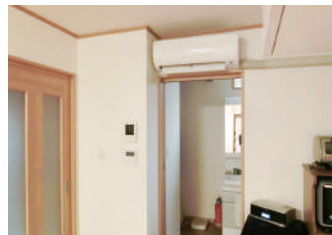
▲1階のエアコンはLDKと脱衣所の間に設置。真冬の脱衣所もポカポカ暖かく、リビングと温度差がありません！