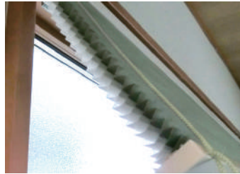
▲ハニカムは「ハチの巣」という意味。ハニカムスクリーンは立体的な空気層で断熱し、窓辺の冷気や熱気を遮ります。