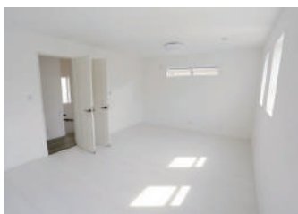
▲明るい光が降り注ぐ2階の子ども部屋。窓は遮熱性の高いLow-E複層ガラスなので、夏を涼しく過ごせます。