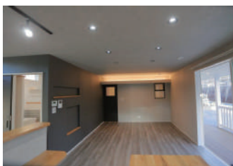
▲リビングとウッドデッキの間に大きな掃き出し窓。それでも冬は暖かいのは、複層ガラスの断熱性のおかげです。

築15年のアパートに住んでいたんですけど、寝室の結露がすごかったんです。夜中に、窓から壁にドボドボと滝