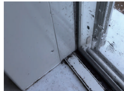
▲結露によって黒カビが発生した窓周り